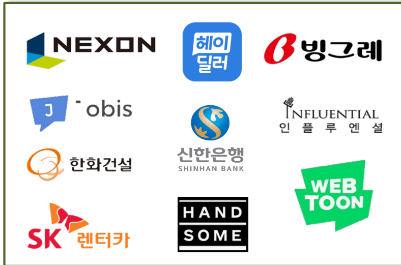
< 신규 광고주 : 본사 >